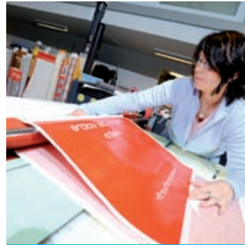
Αναπόσπαστο τμήμα των σύγχρονων επικοινωνιών

Το δεύτερο μέρος του Διαγωνισμού Έκθεσης της Vinyl 2010, με στόχο την ανάμιξη της νέας γενιάς στον διάλογο για την αειφόρο ανάπτυξη ήταν εξαιρετικά επιτυχημένο. Τα αποτελέσματα του Διαγωνισμού Έκθεσης παρουσιάστηκαν στην 17η Συνεδρίαση της Επιτροπής για την Αειφόρο Ανάπτυξη των Ηνωμένων