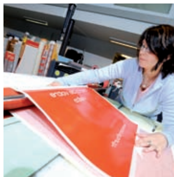
Nieodczony element współczesnej komunikacji

Vinyl 2010 aktywnie działa na rzecz dialogu z udziałowcami, w roku 2009 brał udział w istotnych konferencjach i wydarzeniach. Druga edycja konkursu pisarskiego Vinyl-u 2010, który angażuje młodych ludzi w dyskusję na temat ekorozwoju, była wielkim sukcesem. Wyniki Konkursu na Esej zostały przedstawione na spotkaniu siedemnastki ONZ w Nowym Jorku w 2009, w Brukseli, w czasie Zielonego