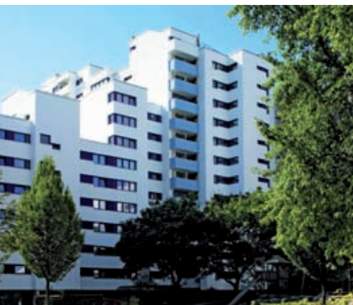
Kobaltowe ramy z wywietrznikami - estetyczne, praktyczne i energooszczędne.

Pomimo trudnej sytuacji rynkowej, europejska branża PCW z nieślabnącym zapałem realizuje swoje cele i zadania związane ze stałym rozwojem, także w roku 2009.